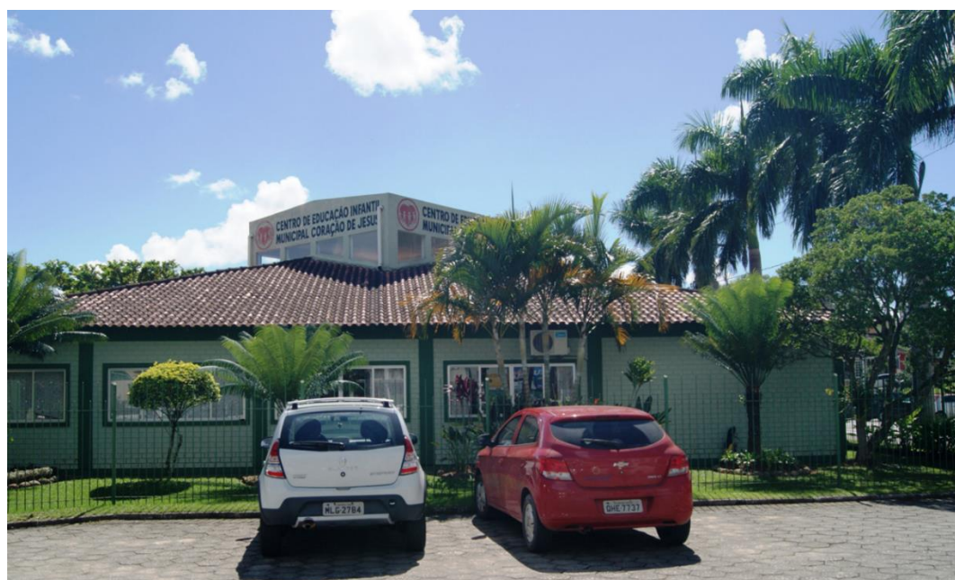
Abrigo12: Centro Educacional Infantil Coração de Jesus Rua Zeno Pauli, 12 Bairro Centro Fonte: www.antoniocarlos.sc.gov.br Acesso em 19/11/2021