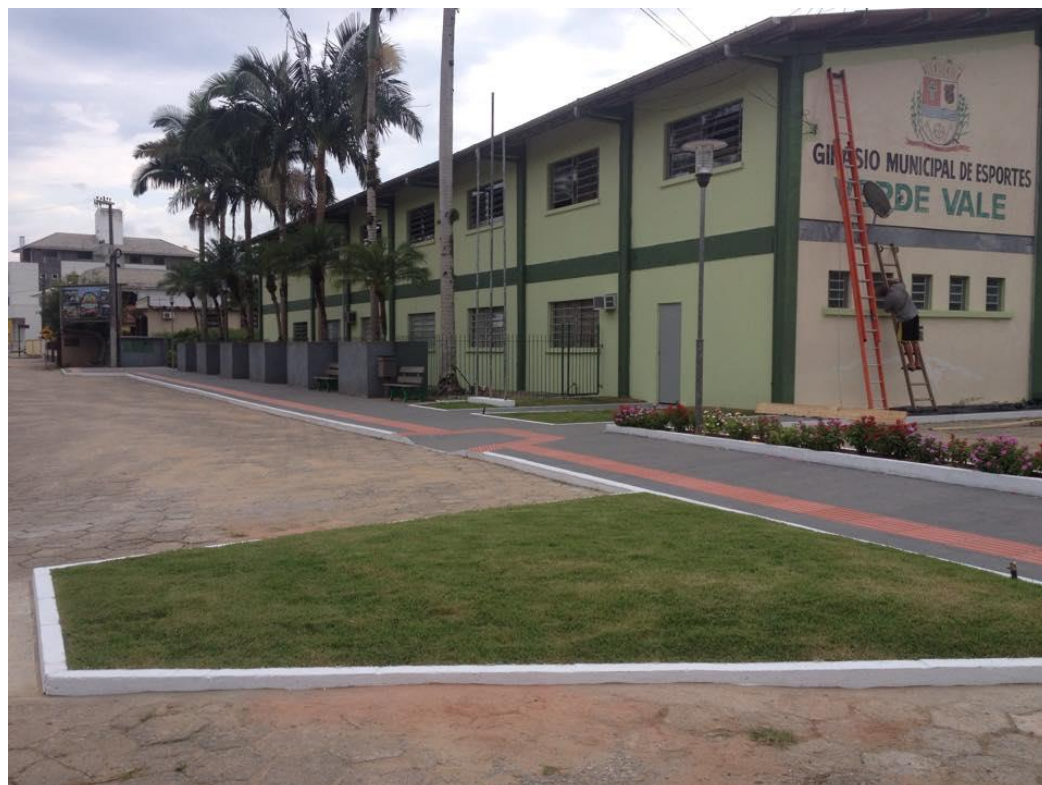
Abrigo 2: Ginásio de esportes Verde Vale, Rua Daniel Petry Bairro Centro