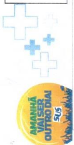
LISTA DE PRESEÇA DA 7ª CONFERÊNCIA MUNICIPAL DE SAÚDE

LOCAL: AUDITÓRIO PREFEITURA MUNICIPAL DATA: 14/03/2023