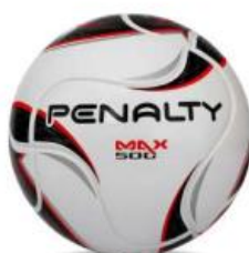
1160 | BC-PT-VM