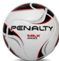
1160 | BC-PT-VM