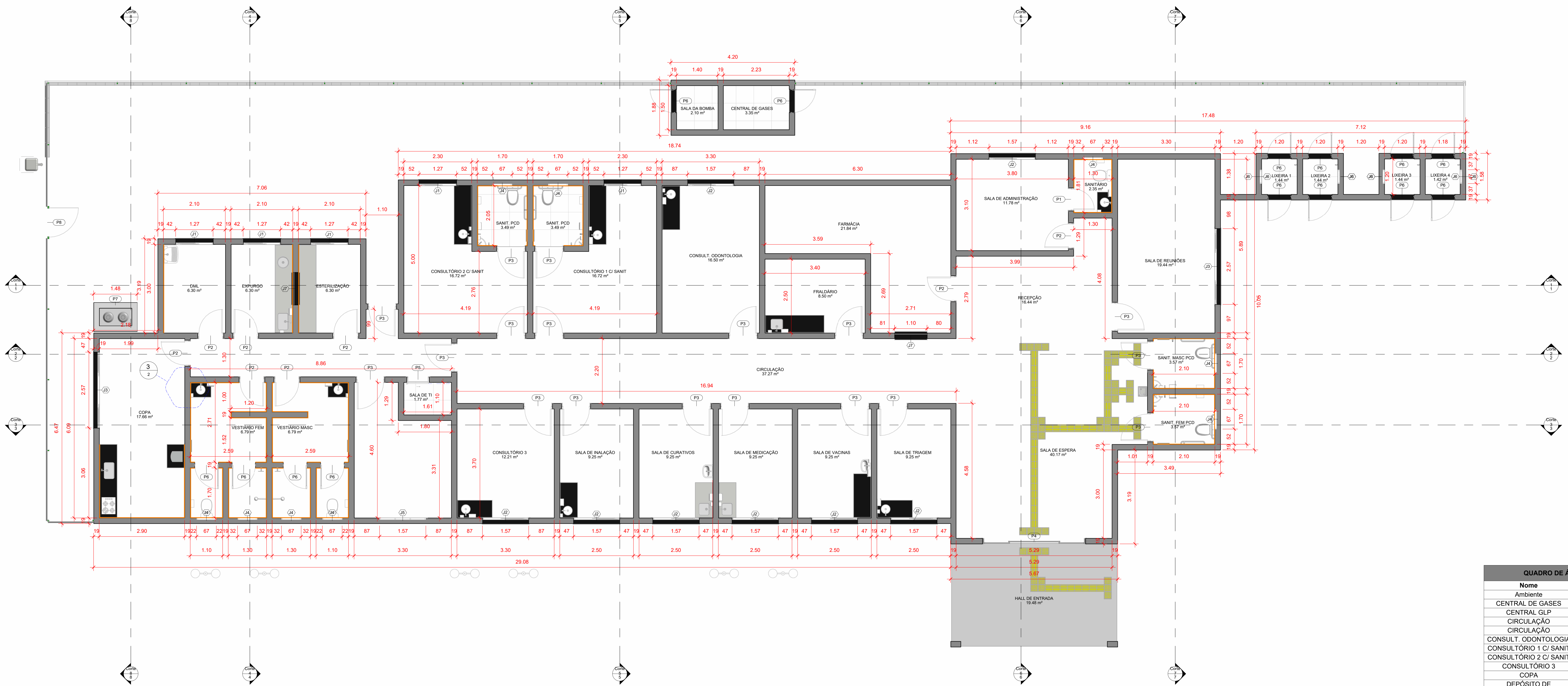
1 PLANTA BAIXA TERRÉO 1 : 50