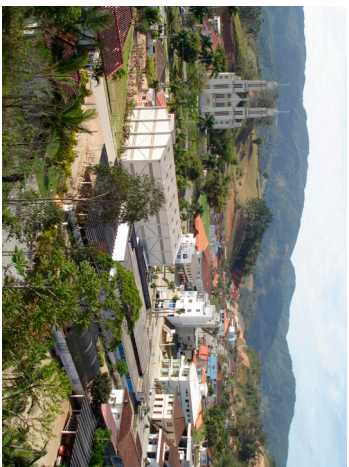
Estudo contempla todas as áreas do município

O Consórcio Hardt Engemim, responsável pela coordenação e condução do processo de revisão do Plano Diretor, concluiu um estudo de diagnóstico que abrange todas as áreas do município. Através deste estudo, será possível analisar mais profundamente as mudanças necessárias ao Plano Diretor da cidade.