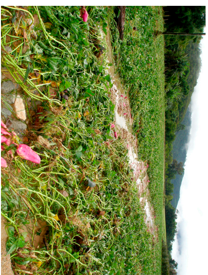
Lavoura de batata-doce destruída pela força da enchente

A Secretaria de Agricultura dará todo o suporte aos agricultores interessados. Participe e ajude a melhorar a qualidade da produção agrícola e o meio ambiente de Antônio Carlos. Para mais informações, procure a Secretaria ou ligue 3272-1123 R230.