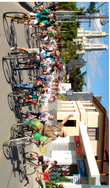
Mais de 130 ciclistas pedalaram por um trânsito seguro e consciente

O Passaieiro Ciclístico concentrou mais de 130 ciclistas entre crianças, jovens e adultos. A atividade marcou o primeiro período do projeto de educação para o trânsito, incluído em Antônio Carlos, com o objetivo de formar futuros motoristas conscientes, preocupados com a segurança. Mais de 280 alunos foram atingidos pelo projeto.