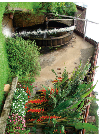
Heranças coloniais são atrativos para o turismo

Representantes das secretarias de Turismo e Cultura destes municípios vem se reunindo periodicamente para o planejamento de ações integradas. O lançamento do “Ca-