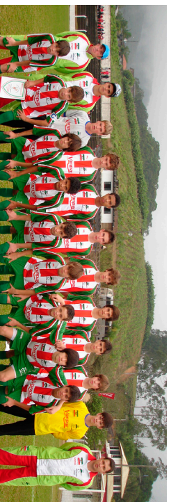
Atletas da Categoria Sub 15. Escolinha já revelou vários talentos para o futebol

A agenda de competições esportivas dos atletas da escolinha de futebol Craque Mirim está cheia de compromissos para esta e as próximas semanas. Os meninos estão participando da disputa de três competições regionais que reúnem centenas de adolescentes em torno da paixão nacional: o futebol. A Craque Mirim participa da “Copa Avaí” e, para agosto, estão programados o “Moleque Bom de Bola” e a “Copa Catarinense de Futebol”.