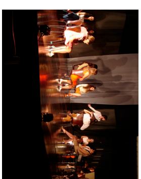
Auditório recebeu peça de teatro

“Antônio Carlos é uma das poucas cidades que têm um espaço adequado para a difu-