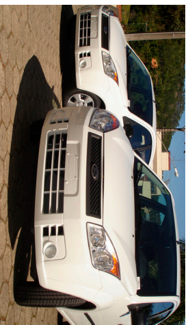
Carros serviço Educação e Administração

A frota municipal ganhou dois veículos novos. Os carros serão usados pelas