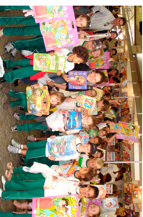
Alunos da escola de Canudos exibem os livros que trouxeram da feira