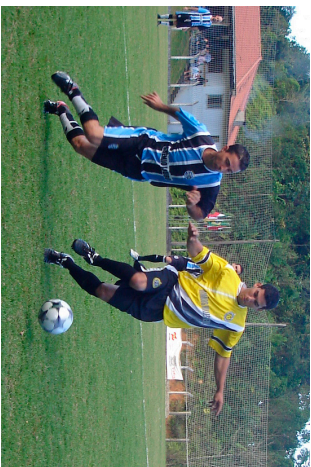
Final do Campeonato deve ser em setembro

A Prefeitura, através da Secretaria de Esportes, está investindo recursos na ordem aproximada de R$ 25 mil na realiza-