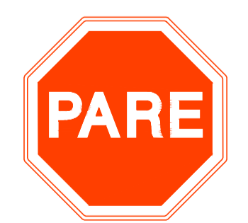
R-1 PARADA OBRIGATÓRIA