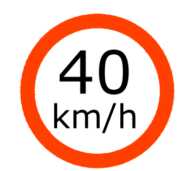
R-19(40) VELOCIDADE MÁXIMA PERMITIDA - 40km/h