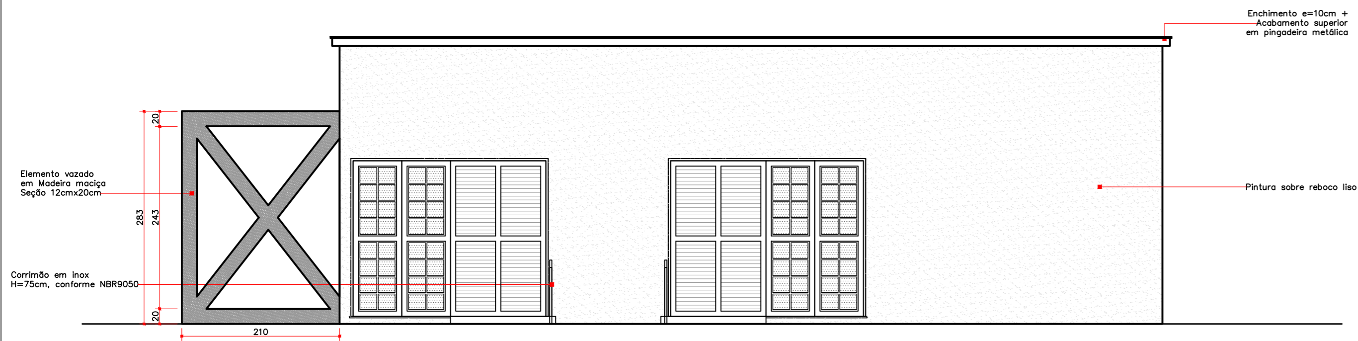
ELEVAÇÃO – VISTA C – SANITÁRIOS E QUIOSQUE ESCALA 1/50